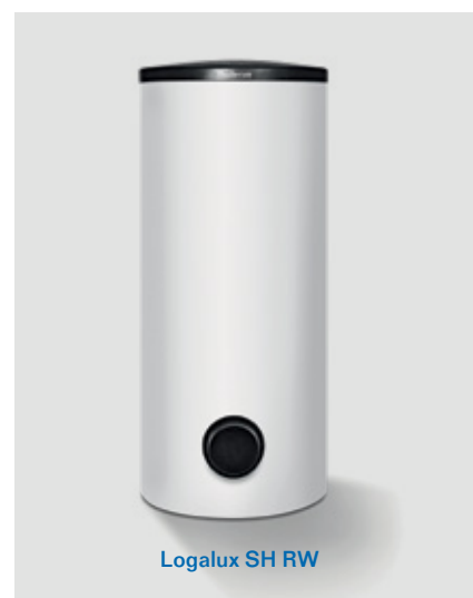
Logalux SH RW

Akumulační zásobník Buderus se stará o optimální dobu provozu Vašeho tepelného čerpadla a tím také o maximální efektivitu. Jak? Zcela jednoduše. Akumulační zásobník slouží pro akumulaci a ukládání tepla, na cestě k vytápění a tím se eliminují krátké pracovní doby chodu kompresoru. Prodlouží se tak nejenom životnost kompresoru, ale také tepelného čerpadla jako celku.