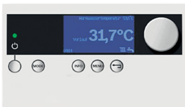
Regulace tepelného čerpadla Logatherm WPS

Regulátor Logamatic HMC 10 plně řídí celý systém vytápění s tepelným čerpadlem Logatherm WPS. Nastavení požadavků je možné zcela jednoduše integrovanou obslužnou jednotkou s grafickým displejem a zvláště jednoduchou obsluhou. Provozní stavy TČ jsou zobrazeny pomocí piktogramu na velkém displeji. Pohyb v menu rozděleném do 4 úrovní je intuitivní. Za pomoci mnoha rychle přístupných funkcí máte úplnou kontrolu nad Vaším tepelným čerpadlem.